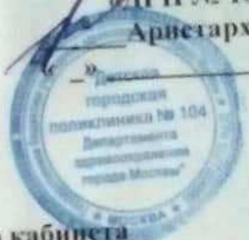
График работы медицинского кабинета