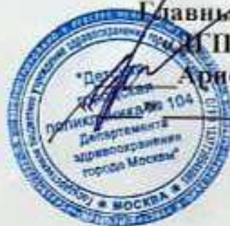
График работы медицинского кабинета